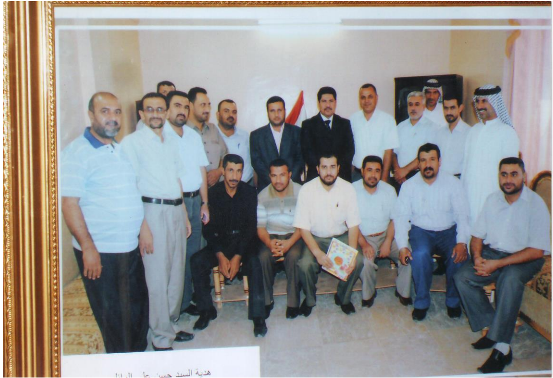
رئيس واعضاء المجلس البلدي مع مدير ناحية سيد دخيل