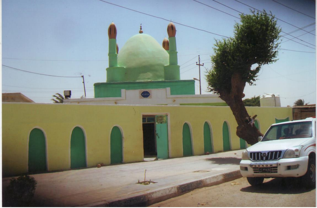
مرقد السيد دخيل الموسوي في الناحية