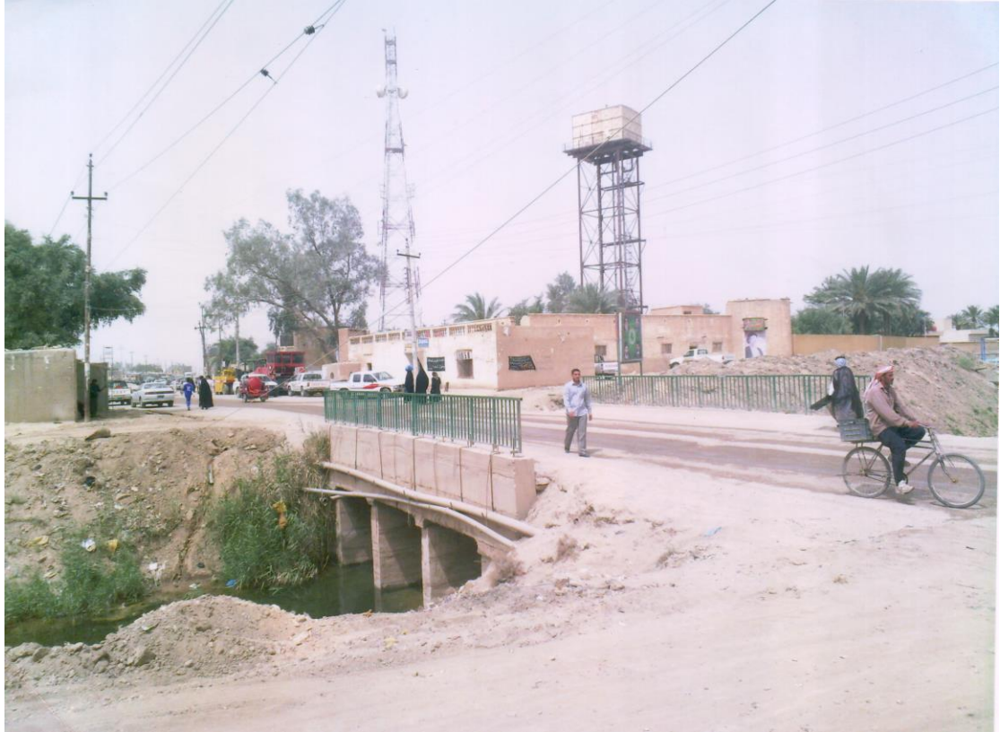
جانب من ناحية سيد دخيل